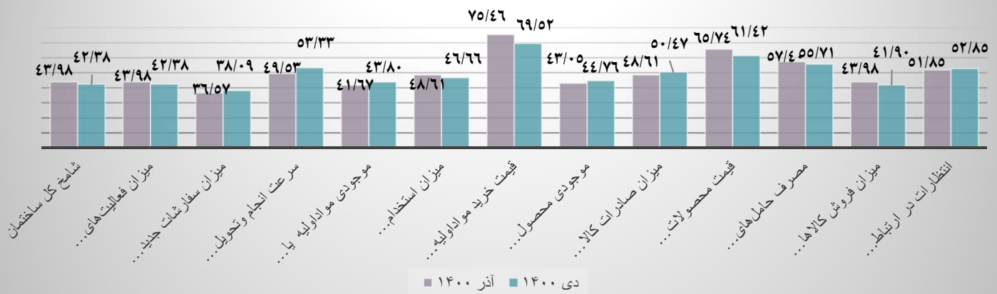
جدول ۳: عددشامخ ترکیبی (تولید، خدمات و ساختمان)